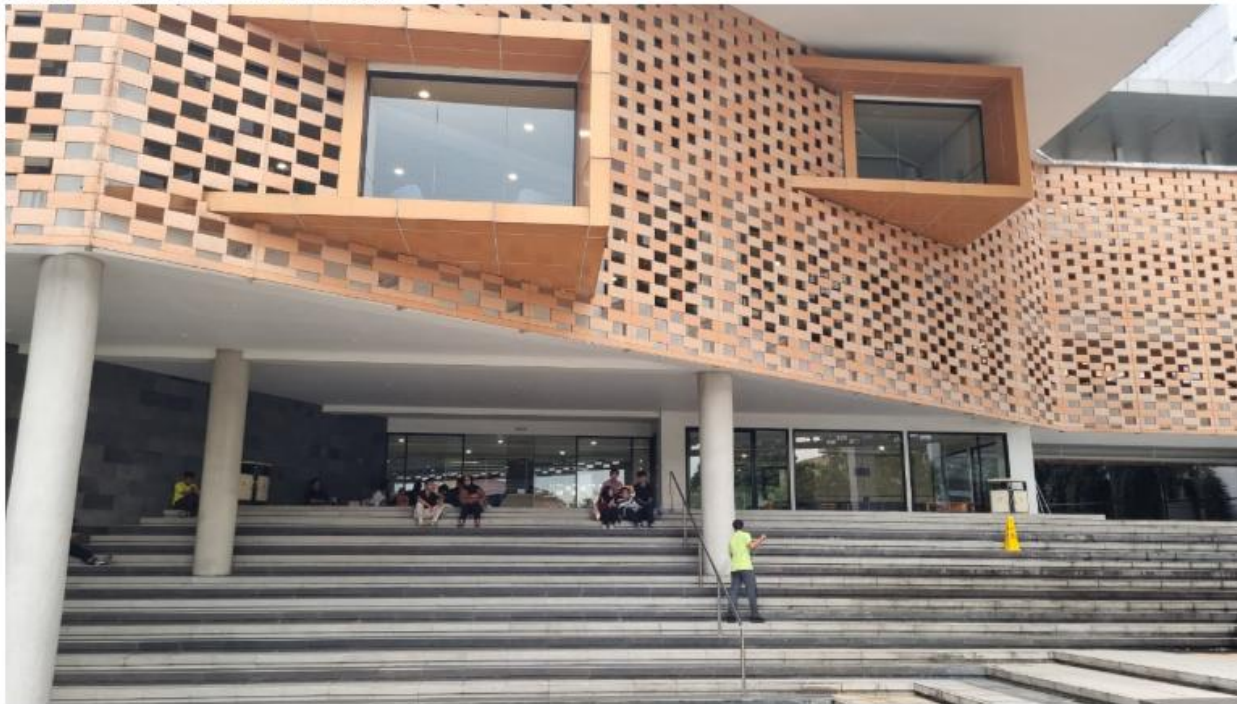
Gedung Administrasi - Kampus Depok

Gedung Administrasi Kampus D Margonda, Depok